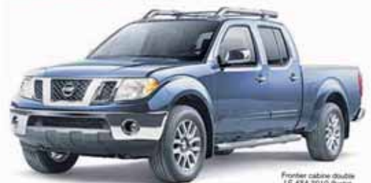
Frontier cabine double LE 4x4 2010 Route

*OFFRE À SÉLECTER DE LA LIQUIDATION DES CRÉDITS ET DES CRÉDITS COMPOSÉS