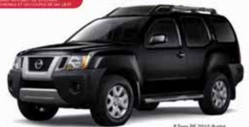
X-Terra SE 2010 Route

*OFFRE À SÉLECTER DE LA LIQUIDATION DES CRÉDITS ET DES CRÉDITS COMPOSÉS