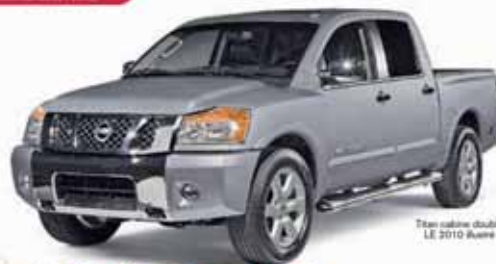
Titan cabine double LE 2010 Route

*OFFRE À SÉLECTER DE LA LIQUIDATION DES CRÉDITS ET DES CRÉDITS COMPOSÉS