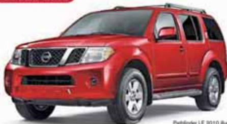
Pathfinder LE 2010 Route

*OFFRE À SÉLECTER DE LA LIQUIDATION DES CRÉDITS ET DES CRÉDITS COMPOSÉS