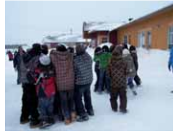
On se prépare pour un autre jeu et on établit notre stratégie