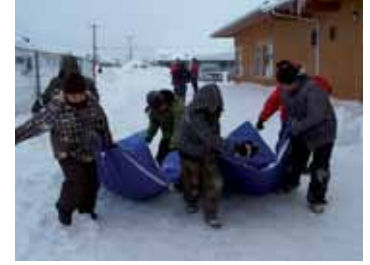
Peu importe le résultat, le travail de collaboration, d'exécution des actions en harmonie avec le groupe, c'est le résultat qui compte