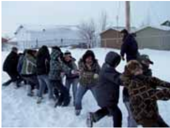
On les voit à l'oeuvre. La force d'équipe, c'est la somme des efforts du groupe.