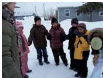
Quelque soit le groupe d'âge, on est concentré et on écoute les consignes