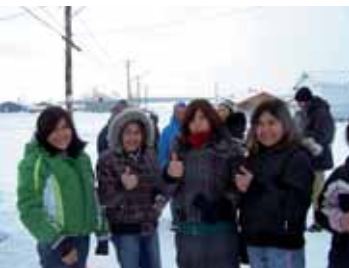
Voici un groupe heureux du résultat.